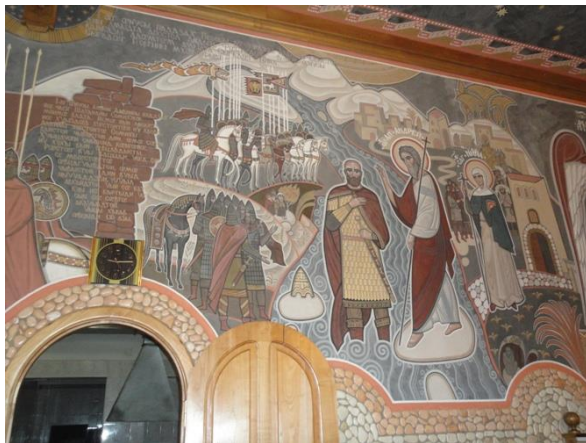
Фреска Аланы принимают крещение от Андрея Первозванного в Храме Святого равноапостольного великого князя Владимира во Владикавказе

Религия относится к важнейшим феноменам культуры. Первое знакомство предков осетин – алан с христианством церковная история связывает с именем одного из ближайших учеников Христа – святого апостола Андрея Первозванного. В середине I века Святой посетил аланский город Фуст, где и проповедовал учение Христа. Известно также, что христианство принимали аланы, жившие при дворе византийских императоров, армянских царей и даже арабских халифов. Христианами стали многие аланы, попавшие в Западную Европу в эпоху Великого переселения народов.