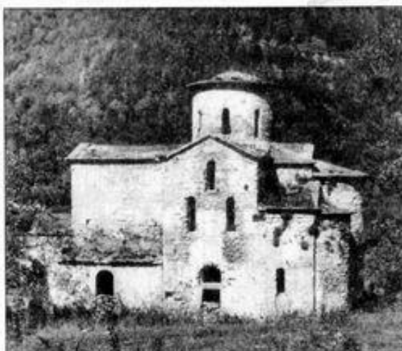
Средний Зеленчукский храм. X в.